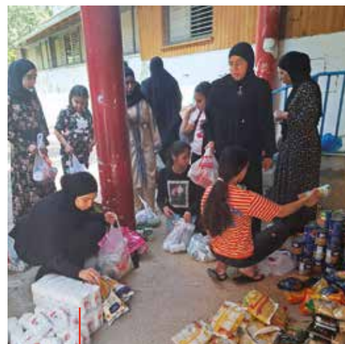
Jungen Frauen beim Pakete vorbereiten, welche später an die Familien verteilt wurden.

Die jungen Frauen des Empowerment-Programms aus Ramle und Lod, sind für ihren Enthusiasmus und ihren freiwilligen Geist bekannt und haben dieses Jahr zwei Kampagnen initiiert. Sie sammelten Spenden und Vorräte in den örtlichen Gemeinden für bedürftige Familien. Eine der Kampagnen bestand darin, hausgemachte Lebensmittel, Kunst, Süßigkeiten, Geschenkartikel und Kinderspiele zu verkaufen. Die Spenden und das durch die Kampagnen gesammelte Geld wurden für den Kauf von Nahrungsmitteln und Hilfsgütern für bedürftige Familien verwendet.