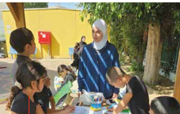
Groupe d'« apprentissage par le jeu » et animatrice bénévole dans une atmosphère protégée.