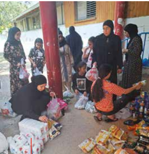
Jeunes femmes en train de préparer des paquets qui seront ensuite distribués aux familles bénéficiaires.

Les jeunes femmes du programme d'autonomisation de Ramlah et Lod sont connues pour leur enthousiasme et leur esprit libre et spontané. Cette année, elles sont à l'origine de deux campagnes. Elles ont recueilli des dons et des provisions dans les communautés locales pour des familles dans le besoin. L'une des campagnes a consisté à vendre des mets, œuvres d'art, sucreries, cadeaux et jeux d'enfants faits main. Les dons et l'argent récolté ont servi à acheter de quoi manger et des produits de première nécessité pour des familles dans le besoin.