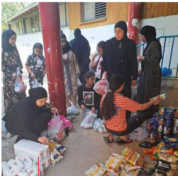
Jungen Frauen beim Pakete vorbereiten, welche später an die Familien verteilt wurden.

Die jungen Frauen des Empowerment-Programms aus Ramle und Lod, sind für ihren Enthusiasmus und ihren freiwilligen Geist bekannt und haben dieses Jahr zwei Kampagnen initiiert. Sie sammelten Spenden und Vorräte in den örtlichen Gemeinden für bedürftige Familien. Eine der Kampagnen bestand darin, hausgemachte Lebensmittel, Kunst, Süßigkeiten, Geschenkartikel und Kinderspiele zu verkaufen. Die Spenden und das durch die Kampagnen gesammelte Geld wurden für den Kauf von Nahrungsmitteln und Hilfsgütern für bedürftige Familien verwendet.