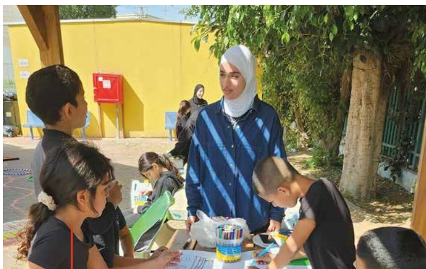
«Lernen durch Spielen»-Gruppe mit ehrenamtlicher Betreuerin in geschützter Atmosphäre.