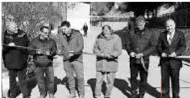
Inauguration solennelle de la promenade réaménagée en présence de Jean-Daniel Ruch, l'ambassadeur suisse.

a permis l'extension de l'ancienne promenade du village d'enfants. L'inauguration solennelle a eu lieu le 9 janvier 2017 avec les enfants, en présence de Jean-Daniel Ruch, l'ambassadeur suisse, et d'autres invités. La célébration s'est poursuivie par une visite du village d'enfants et s'est terminée autour d'un repas commun.